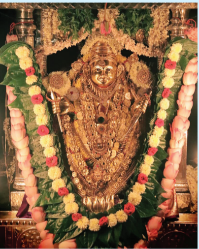
ಬಹುಮಾನ ಶ್ರೀ ದುರ್ಗಾಪರಮೇಶ್ವರಿ ದೇವಸ್ಥಾನದಲ್ಲಿ ಭಾನುವಾರ ಶ್ರೀ ಕದಂಬ ವನವಾಸಿನಿಯ ವಿಶೇಷ ಅಲಂಕಾರದಲ್ಲಿ ಕಂಗೊಳಿಸುತ್ತಿರುವ ಬಹುಮಾನ ದುರ್ಗ.