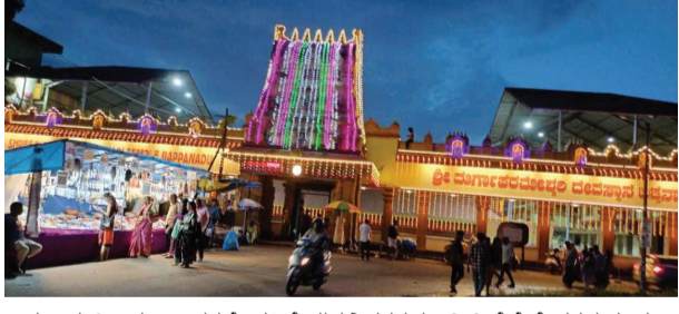
ಬಹುಮಾನ ಶ್ರೀ ದುರ್ಗಾಪರಮೇಶ್ವರಿ ಕೆತ್ತಲಲ್ಲಿ ಶರನ್ನವರಾತ್ರಿ ಒನ್ನಲ ದೇವಳದ ಪೂರ್ವ ಮತ್ತು ಪಶ್ಚಿಮ ಭಾಗದಲ್ಲಿ ಎಮ್.ತ್ ದೀಪಗಳಿಂದ ಅಲಂಕಾರ ಕಣ್ಣ ಸೆಳೆಯುತ್ತಿದೆ.